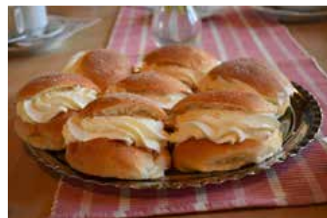
Fastlagsbullar i Södra Sandsjö församlingshem.

Inte för stor. Mandelmassan får gärna ha lite små mandelbitar men inte vara blandad med grädden. "Hatten" ska vara lite mindre än botten.