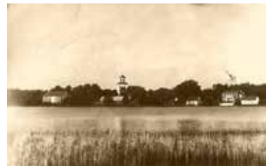
Gammal bild över Södra Sandsjön

kl 10.00 - 16.00 Södra Sandsjödagarna Öppet hus i församlingshemmet med kaffeservering. Passa på att rösta på årets Sandsjökaka. Utställare och försäljning av hantverks alster & konst. Hembyggsföreningens arkiv är öppet.