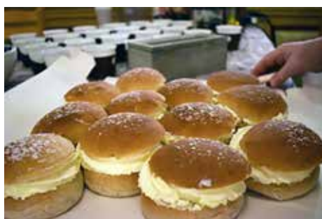
Fastlagsbullar i Väckelsång

Roland Sjögren Hur ska en fastlagsbulle vara? Grädde blandat med inkråmet och mandelmassa. Inget florpuder för det hamnar ändå bara i näsan. Varför är du kyrkan idag? Det är lugnt och avkopplande i kyrkan. Och sen är det semlor och det förhöjer det hela.