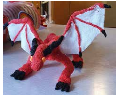
Douglas Heim skulpterade en udda och grym drake i Väckelsång