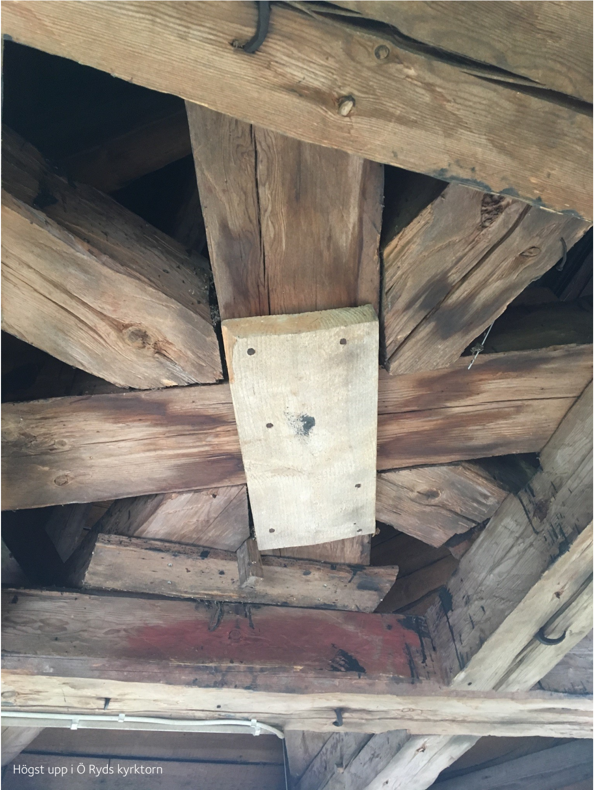
Högst upp i Ö Ryds kyrktorn