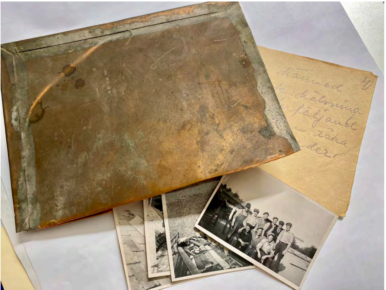
Kopparkuvertet med innehåll – en tidskapsel som återfanns under södra lågdelstaket mot tornet.