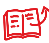
Tro och lärande