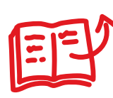
Tro och lärande