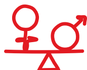
Jämställdhet och hälsa