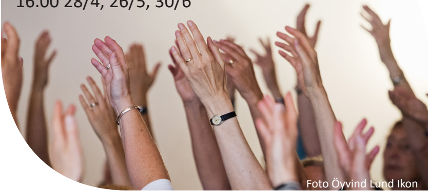
Ikon