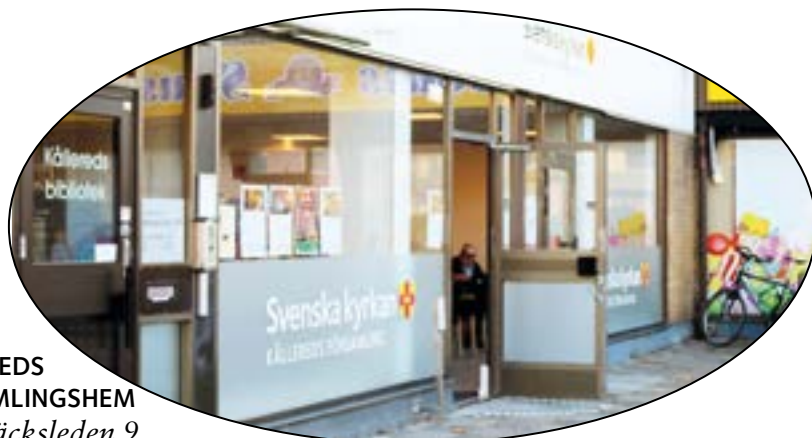
KÅLLEREDS FÖRSAMLINGSHEM Hagabäcksleden 9

www.svenskakyrkan.se/molndal/kalender-kallered