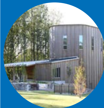
LIVEREDS KAPELL Högenvägen 1 Lördag 17/10 och 14/11 kl 17 Musikgudstjänster, för program se kalendern