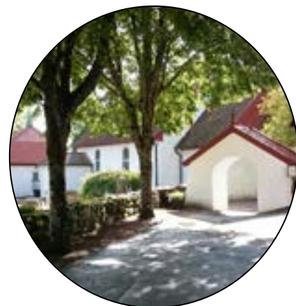
KÅLLEREDS KYRKA Norra Kyrkvägen 16

Kyrkomusiker 0738-520 376 stoyan.iliev@svenskakyrkan.se