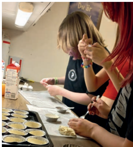
Fredagshäng i Stensjökyrkan