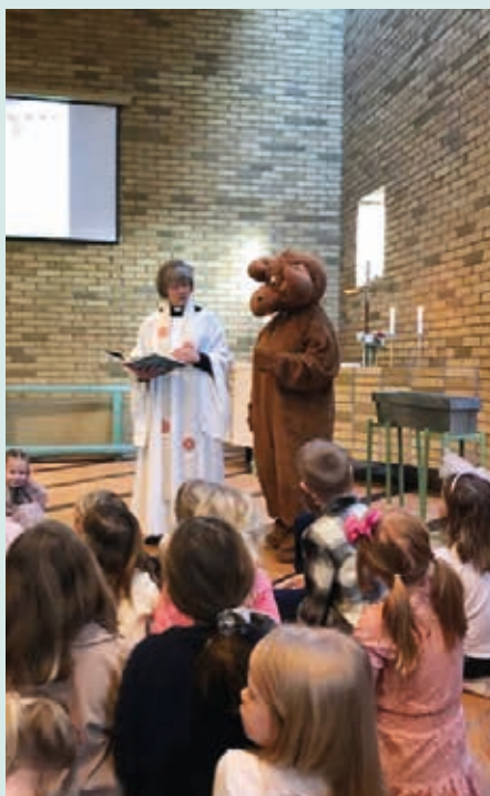
Älgen Fure , som annars bor i Furulunds-kyrkan, var på besök i Stensjökyrkan på familjegudstjänsten 6/2.