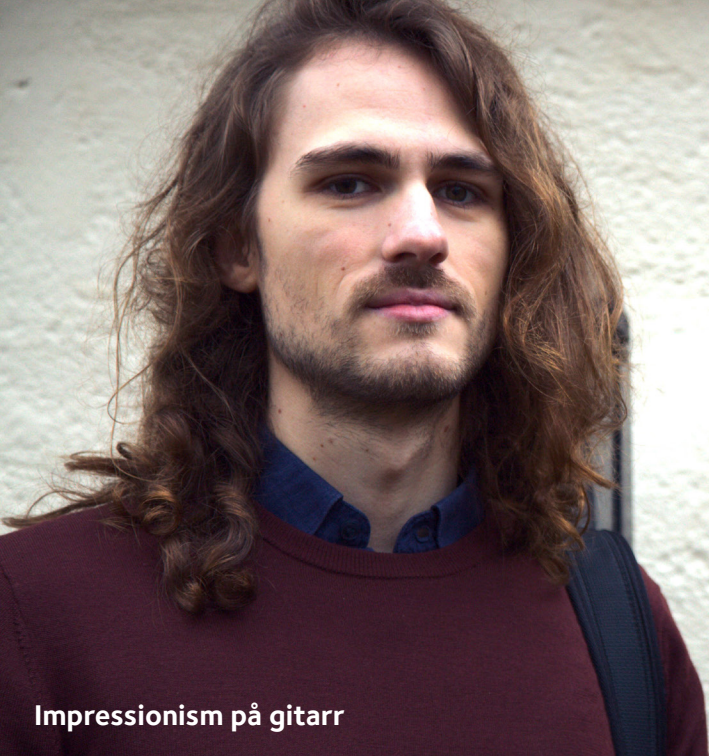
Impressionism på gitarr