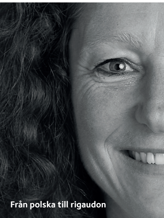
Från polska till rigaudon