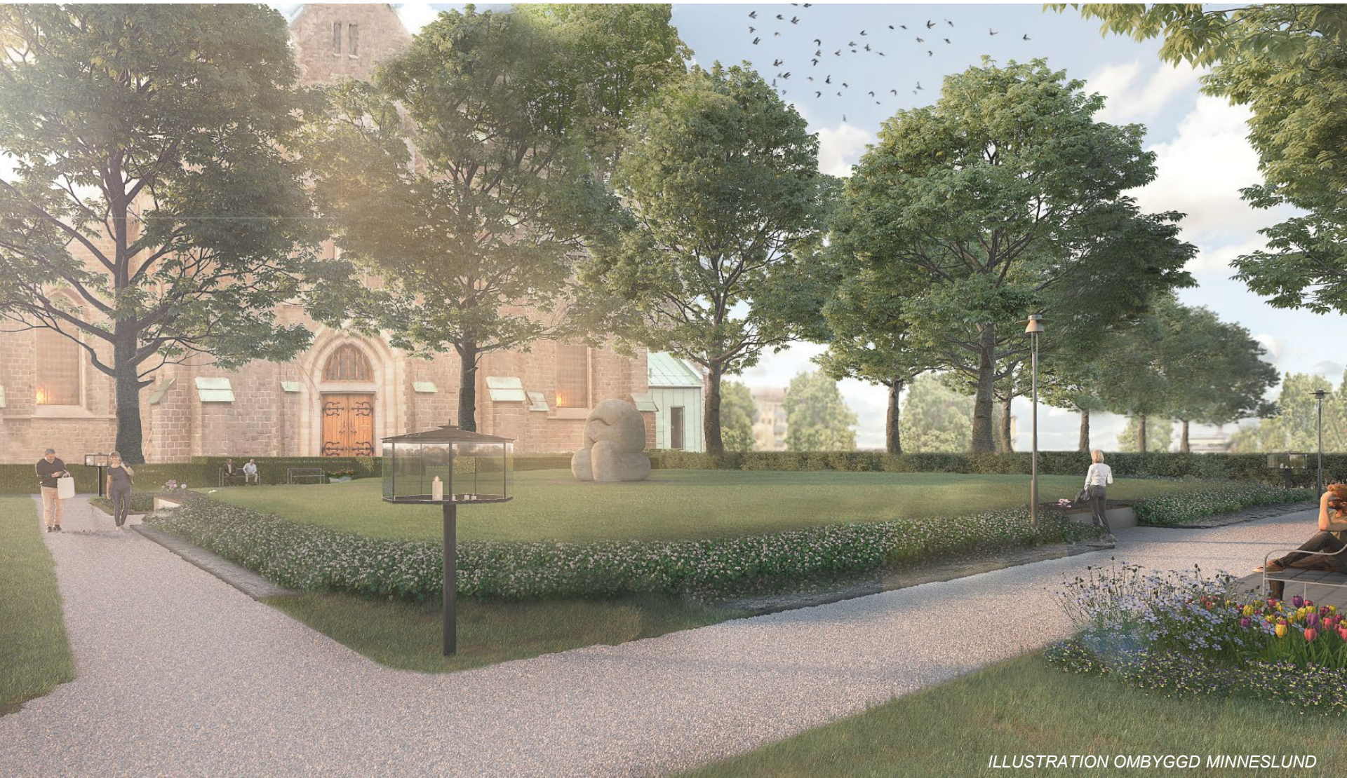
ILLUSTRATION OMBYGGD MINNESLUND