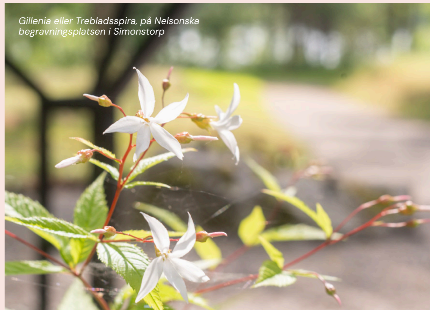
Gillenia eller Trebladsspira, på Nelsonska begravningsplatsen i Simonstorp

Under v 24-34 har vi öppet 09-12, men utan soppa. Från 26/8 har vi öppet som vanligt igen.