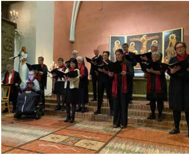
Kyrkokören vid Julmusiken på Trettondedag jul