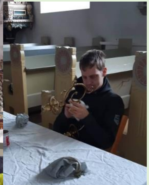
Putsning av ljuskronorna i Verums kyrka