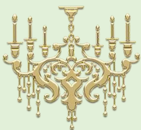
Inventering i Verums kyrka