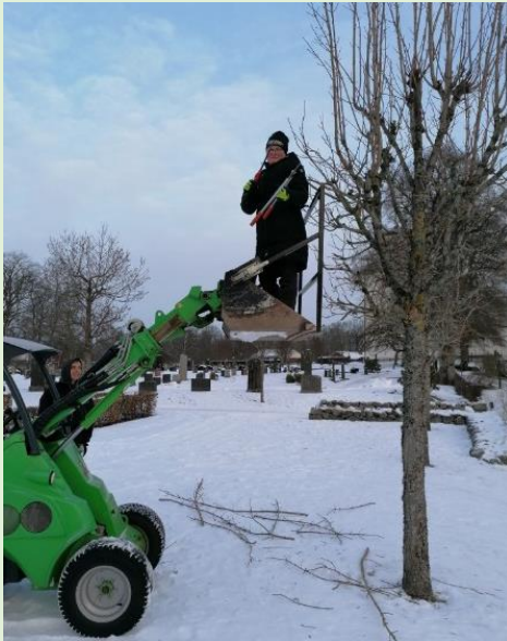
Klippning av träd på Vittsjö kyrkogård