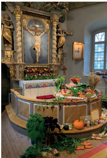
Några bilder på den vackra utsmyckningen i Velinga kyrka på tacksägelsedagen.