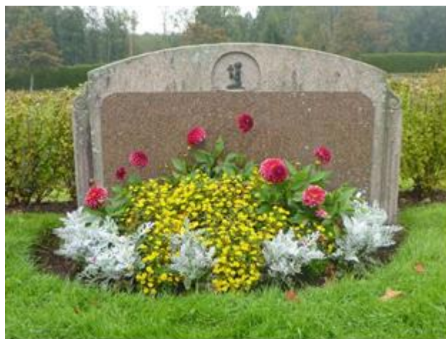
Tagetes, Dahlia, Husarnapp och Silverek