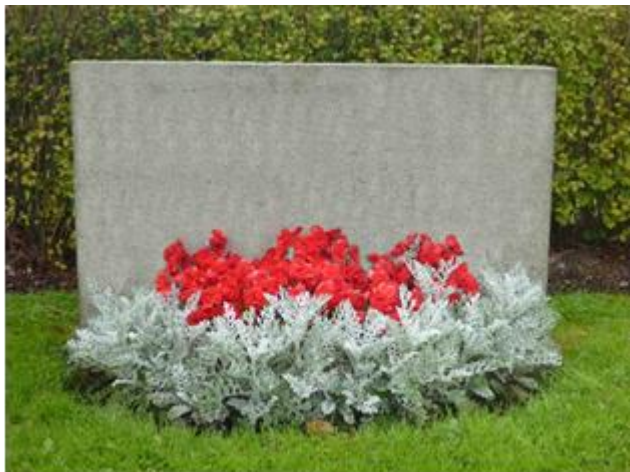
Begonia och Silverek