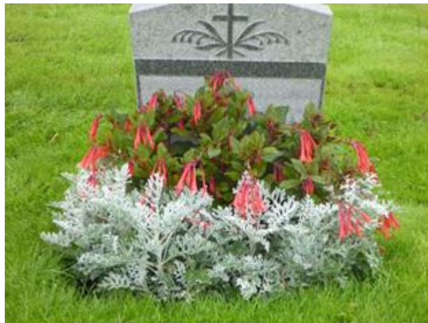
Fuchsia och Silverek