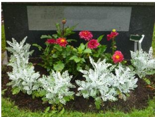
Dahlia och Silverek