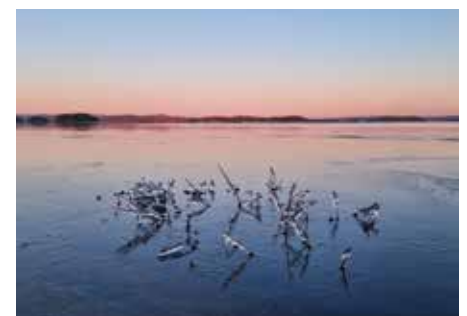
Två av bidragen.