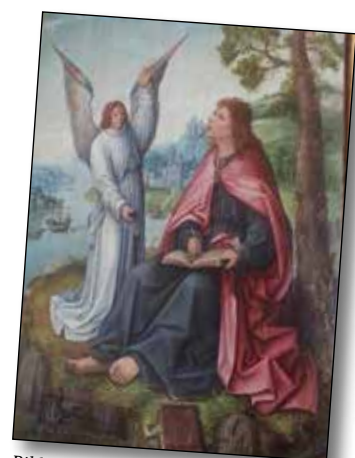
Bilden är tagen i Sala Sockenkyrka.

vuxna men du är välkommen från 16 år. Det är bra om du har en egen bibel men har du ingen hör av dig. Vi jobbar oss igenom uppenbarelsboken ett par kapitel per gång och till första träffen kan du läsa kapitel 1 och 2. Träffarna är på Mikaelsgården, Sala - en trappa upp i Schwerinrummet. Varmt välkommen hör gärna av dig om du har frågor.