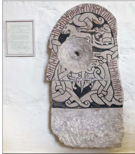
Först runsten, sedan även piscina. Nu hänger den på väggen i Sproge kyrka.

Även runstenar infogades i kyrkor under medeltiden. Här är en runsten som återfanns vid en restaurering 1965. Den har varit använd som piscina i absiden. Därför är ett hål borrat rakt igenom den.