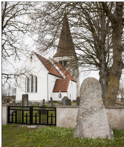
Sandas bildsten med den typiska svampformen. Numera placerad utanför kyrkogården.

Flera bildstenar har hittats i jorden på södra kyrkogården. En av dem har nu (2006) placerats utanför kyrkogården.