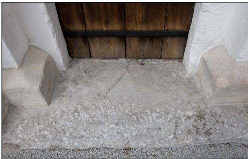
Ekstas slitna stentröskel har små rester av mönster i övre vänstra hörnet.

Bildsten använd som tröskel i västra långhusportalen. En länk in i kyrkan?