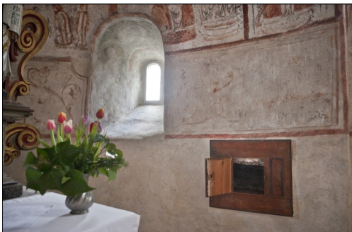
Mästerby har en bildsten i väggskåpet.

Det är inte lätt att se det, men inne i väggskåpets tak finns en bit av en bildsten inmurad.