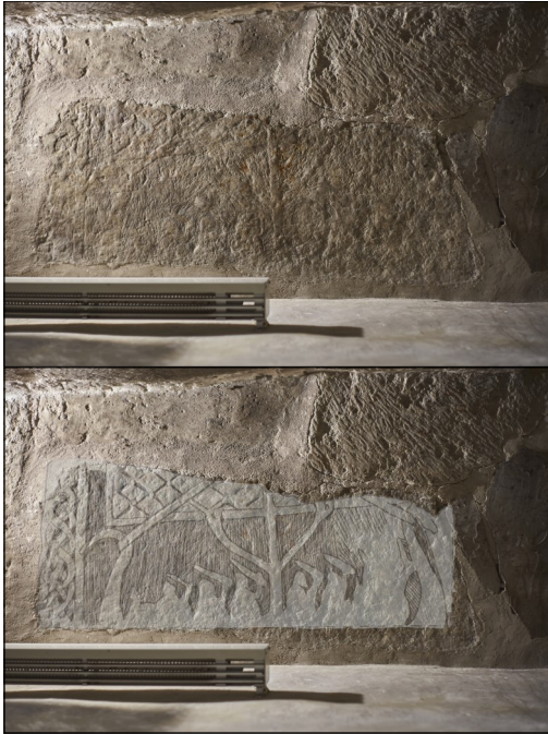
Foto: Per Widerström Nedersta bilden är digitalt sammansatt med en teckning av Beate Böttger.

I korgolvet bakom altaret finns denna skärva med motiv från en vikingatida seglats.