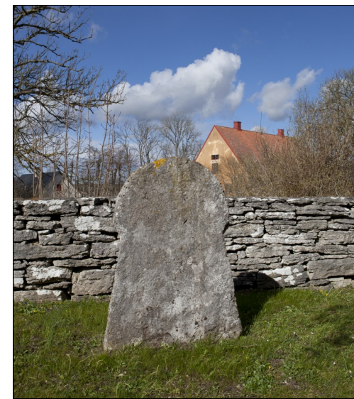
Hejdes bildsten på kyrkogården. Svampformad, men lite mindre än stenen i Sanda.

I Hejde hittades denna bildsten under golvet i sakristian. Den finns nu på norra sidan av kyrkogården.