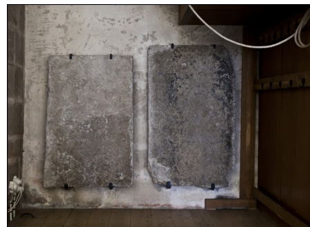
Väte. Bildstenar på västväggen.

Dessa två bildstenar låg i korgolvet. De har huggits till bygganpassade fyrkantiga plattor. Nu sitter de uppsatta på västväggen vid orgeln.