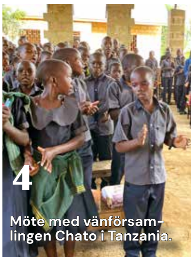
Möte med vänförsamlingen Chato i Tanzania.

PRODUKTION Hjo pastorats kyrktidning "Ibland oss" delas ut till samtliga hushåll fyra gånger per år.