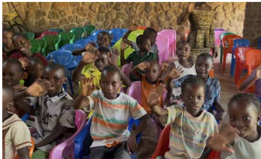
Barnkören i Chato skickar en hälsning till barnkörerna i Hjo pastorat.