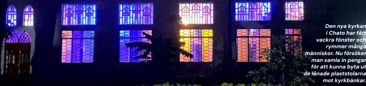
Den nya kyrkan i Chato har fått vackra fönster och rymmer många människor. Nu försöker man samla in pengar för att kunna byta ut de lånade plaststolarna mot kyrkbänkar.