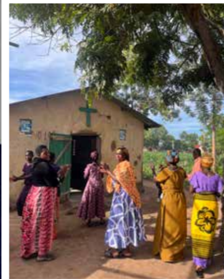
När vi kom till kyrkan i Bwina hälsades vi med sång, glädjetjut och dans.