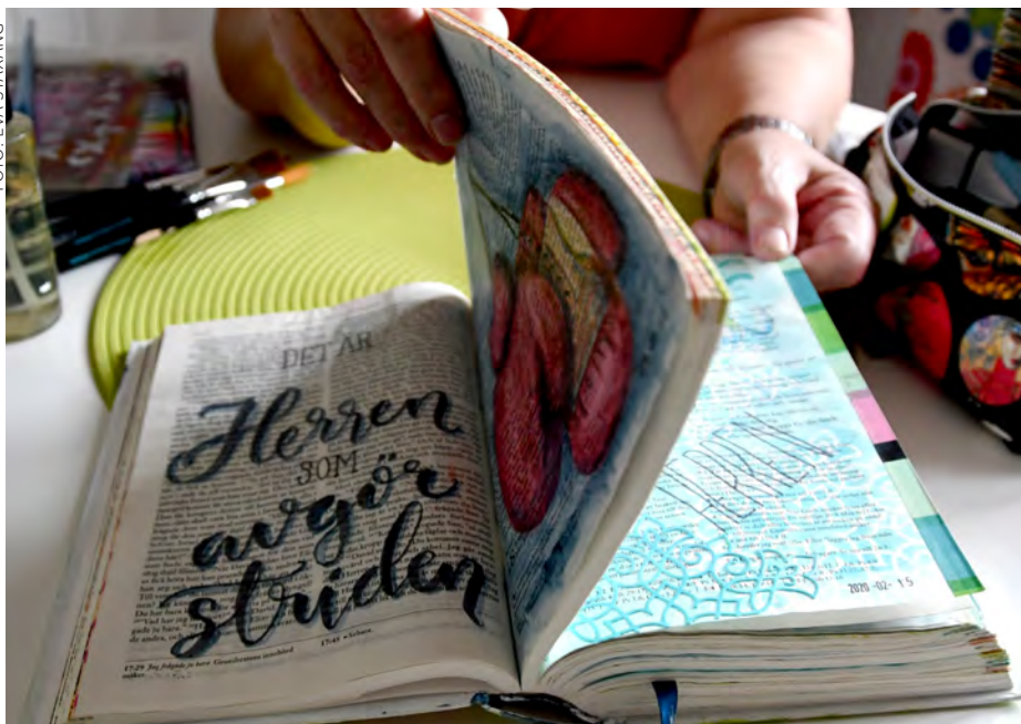
Det finns inga begränsningar för Kreativ bibelläsning när det handlar om val av färger och material.