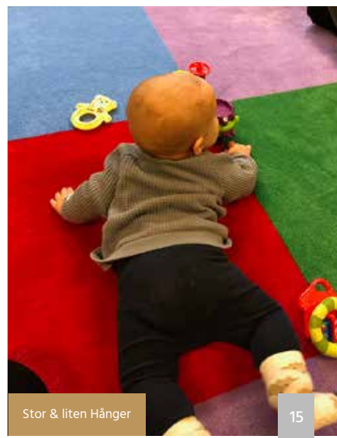
Stor & liten Hånger