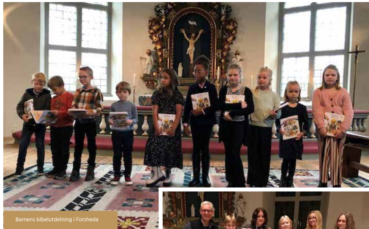
Barnens bibelutdelning i Forsheda