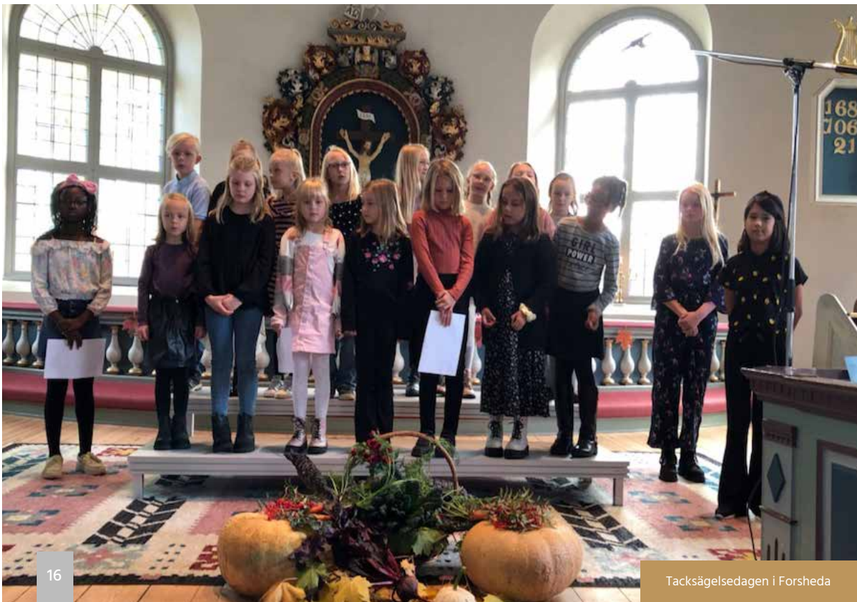
Tacksägelsedagen i Forsheda