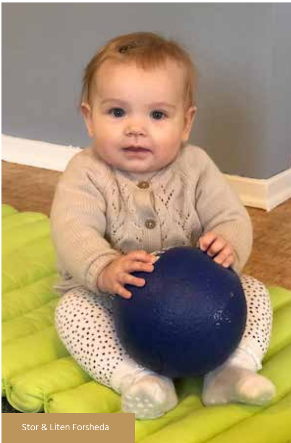
Stor & Liten Forsheda