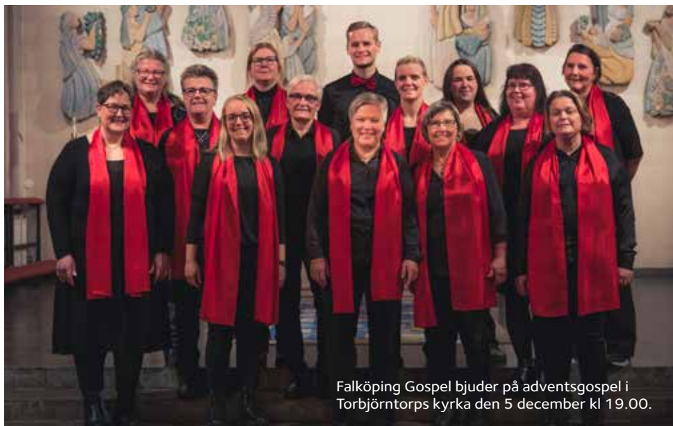
Falköping Gospel bjuder på adventsgospel i Torbjörntorps kyrka den 5 december kl 19.00.

Du hittar all musik och alla gudstjänster i kalendariet längst bak i tidningen. En kalender som alltid är uppdaterad finns på pastoratets hemsida. Hoppas att vi ses i kyrkan!