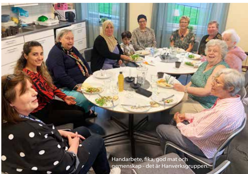
Handarbete, fika, god mat och gemenskap - det är Hanverksgruppen.