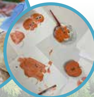
Under höstlovsveckan fick stor&lite gruppen ett gemensamt och lite extra mysigt möte! Det blev nybakta frallor och kaka, samt att barnen fick höstpysla!