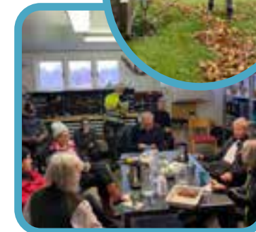
Vi vill tacka all ideella som ställde upp och hjälpte till på våra arbetsdagar med vaktmästeriet! Tillsammans räfsade vi löv och lade granris på alla våra skötselgravar!