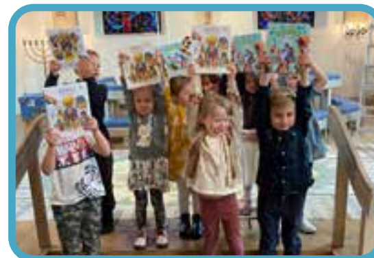
Det har varit familjegudstjänster i Bredaryds och Kulltorps församlingar. Det blev utdelning av biblar till alla 4-åringar och utdelning av dopänglar till alla nydöpta under året som gått. Allt avslutades med dopkalas i församlingshemmen efteråt.