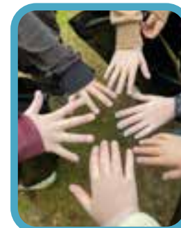
"Håll Sverige rent."