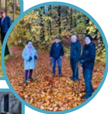
Höstens pilgrimsvandringar har bjudit på fantastiska upplevelser! Under ett tillfälle i höst åkte både Bredaryds och Värnamos pilgrimsvandrare till Eskilstorp och hade en gemensam vandring.