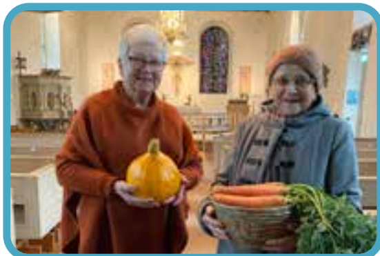
Pyntade kyrkor i Bredaryd och Kulltorp inför tacksägelsedagen!