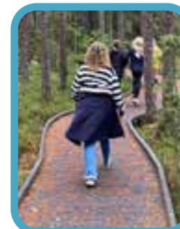
Borgen i Värnamo!