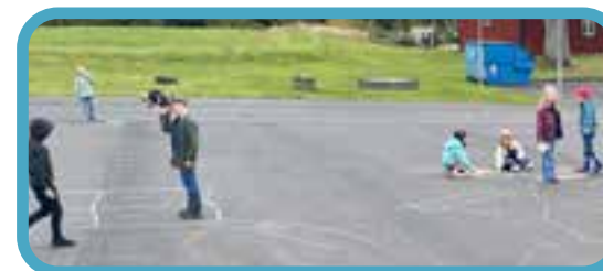
Miniorerna har startat upp i Kulltorp igen med ett stort och härligt gäng!

Vi planerar att starta upp våra körer så snart som möjligt, mer info om starter kommer vid ett senare tillfälle. Håll utkik på vår hemsida och facebookside!