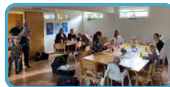
Under hösten har vi, vid olika tillfällen, slagit ihop våra Stor & liten-grupper i Bredaryd och Kulltorp, och haft gemensamma träffar!