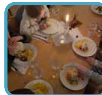
I Kulltorp hölls en vardagsgudstjänst där barnen i våra barngrupper fick delta i gudstjänsten, efteråt serverades tacos i församlingshemmet!