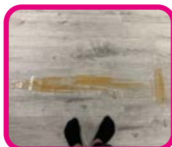
Jesus möter fiskare som ska bli lärjungar bild på en fisk.