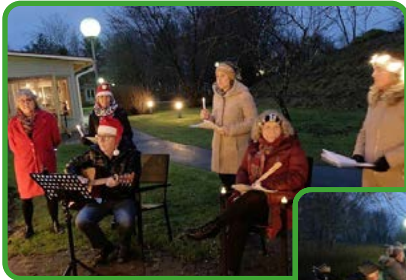
Under två eftermiddagar trotsade personalen kyla och regn för att sjunga adventssånger och julpsalmer för de boende på Bredäng.