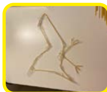
Jesus blev döpt av Johannes då kom en duva. En spaghetti duva