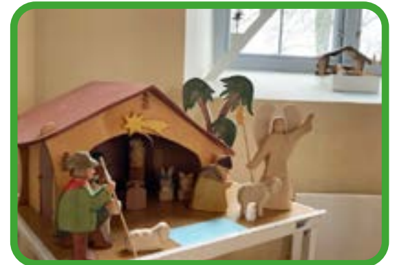
Under adventstid ordnades det upplevelsevandringar i våra kyrkor, i Bredaryd kunde man beskåda och läsa om olika julkrubbors historia. I Kulltorp kunde man gå en fin bönevandring i kyrkan. Fika stod framdukat för självservering. Det fanns även en tipspromenad att gå runt kyrkornas område, vinnarna överraskades med fina priser.