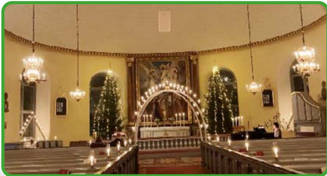
Tyvärr snuvades vi alla på julbön, midnattsmässa och julotta 2020. Istället hölls våra kyrkor öppna mellan 16-19, personal fanns på plats och alla ljus var tända. Besökarna fick ibland vänta utanför portarna för att undvika trängsel och för att hålla på restriktionerna. Evangelium lästes ett par gånger under denna tid, musik kunde njutas av och vi sjöng även psalmer.