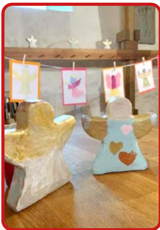
Höstens första Himlajus var i Kulltorp på ängladagen. Duktiga barn sjöng för oss och efteråt fick alla ta del av barngruppernas mini- utställning med änglar och sen var det bullfika. Även i Bredaryd firades dagen med gudstjänst tillsammans med vår nya konfirmandgrupp. Själveste kyrkoherden bredde ut sig med änglavingar.