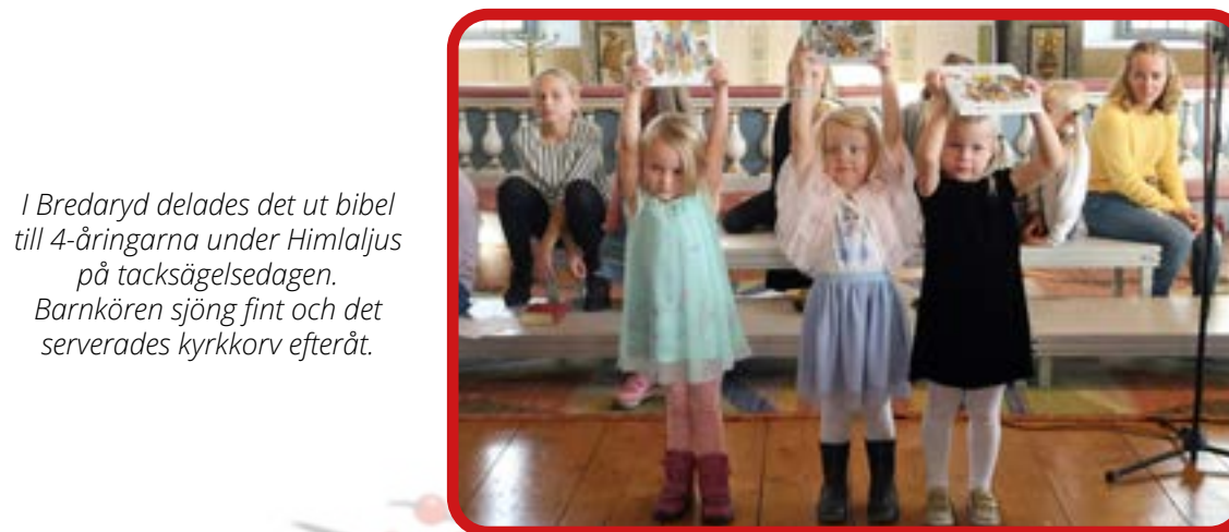
I Bredaryd delades det ut bibel till 4-åringarna under Himlajus på tacksägelsedagen. Barnkören sjöng fint och det serverades kyrkkorv efteråt.