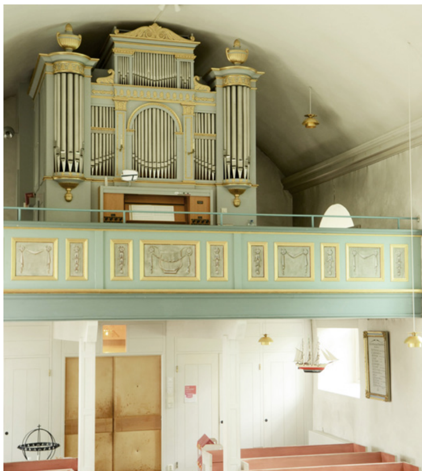
Kyrkorummet mot väster