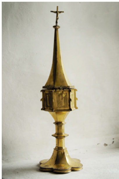
Ciborium, förvaringskärl för det invigda nattvardsbrödet

spetsig spira med kors och bär den graverade inskriptionen "JESUS" med gotiska bokstäver.