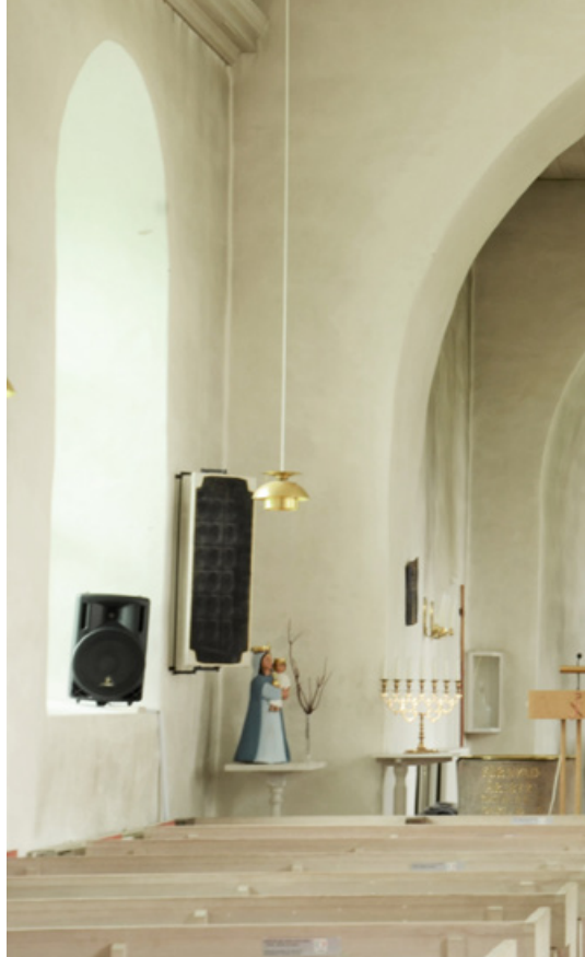
Kyrkorummet mot öster

Frinnaryds kyrka är i grunden en gammal kyrka, men också den har gjort sin tidsresa. Mycket har förändrats i enlighet med nya tiders smak och tankar om hur man bäst ska gestalta det heliga som en kyrka vill berätta om. Men innan man möter kyrkorummet som på många sätt känns modernt kommer man in genom en tornportal som är nyromansk, och man kan i kyrkan se koret med sin absid som också hälsar till oss från medeltiden.