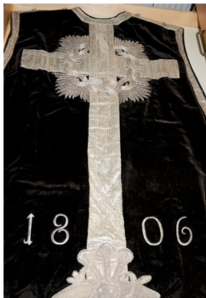
Svart mässhake från 1806