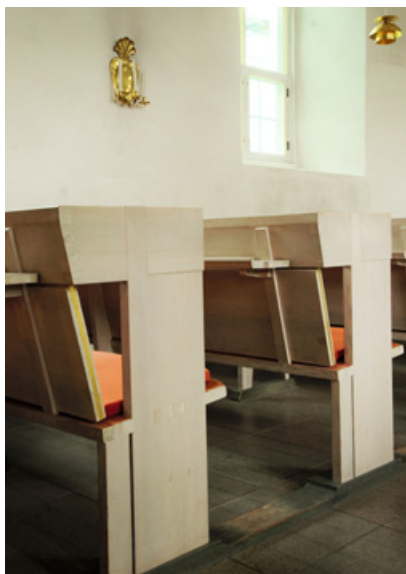
Bänkinredning av Erik Lundberg

År 1659 slog blixten ned i kyrkan och brände av taken. Man kan på vinden ännu se de skörbrända stenarna i östra gavelröset. En del av inventarierna kunde räddas. Efter detta återställdes kyrkan och moderniserades. Från denna tid är troligen det vinkelbrutna fönstret i södra absidmuren där man på 1920-talet hittade rester av en dekorativ kalkfärgsmålrad omfattning i renässansstil. Åtminstone vid denna tid, kanske även tidigare, hade kyrkorummets väggar målningar, varav rester ska finnas under putsen. Kyrkan försågs med predikstol i bildhuggeriarbete med målade skildringar av evangelisterna. År 1693 byggde Eksjö stads snickarmästare Måns Börjesson och Lars B. Höfling nya bänkar samt läktare i väster och norr. Det finns en bänklängd från 1695 bevarad där det framgår var varje hemman hade sin plats i kyrkan. På läktarna satt socknens ungdom. Tillsammans med de plana brädtagen kom läktarna att dekoreras i barockstil år 1744 av målarmästaren Peter Wadsten från Eksjö. På läktarna målades med oljefärg de tolv apostlarna, i långhustaket Gud