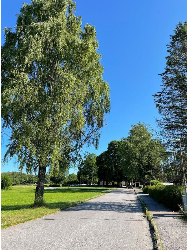
Vy mot norr och parkering framför kyrkan.