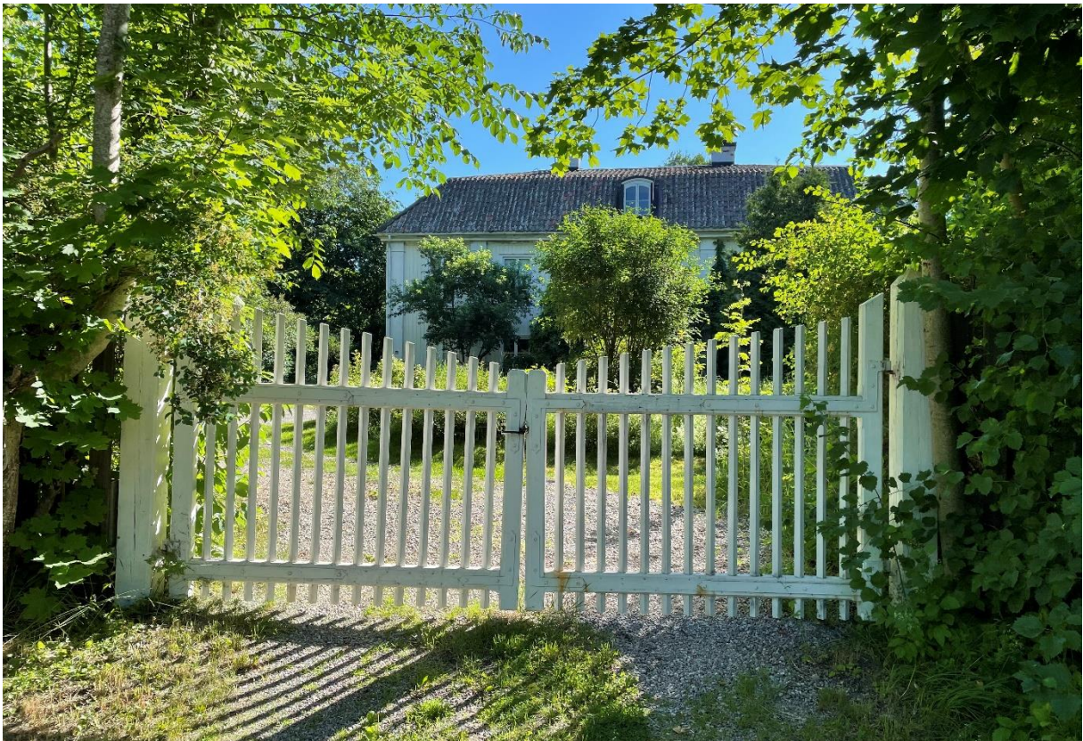
Före detta prästgårdens mangårdsbyggnad.