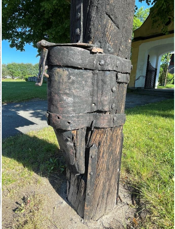
Pengabössan vid södra kyrkporten.