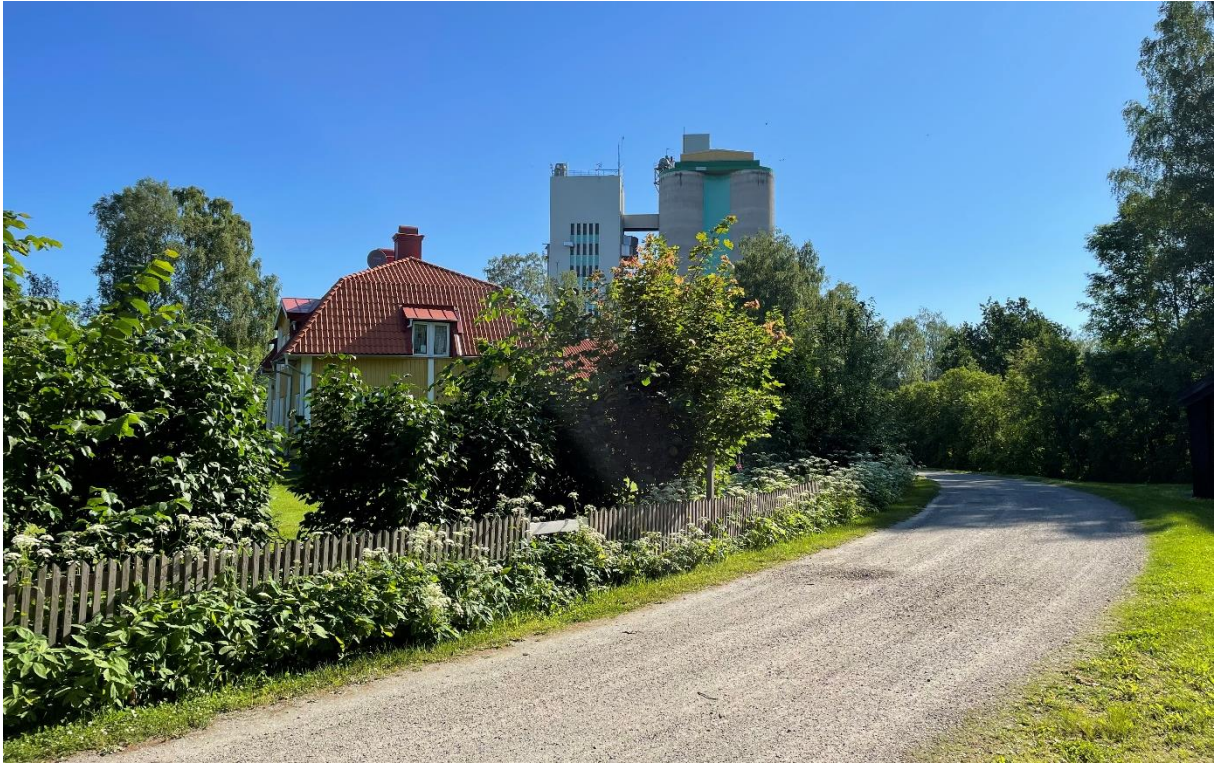
Väg genom kyrkbyn med silo i fonden.