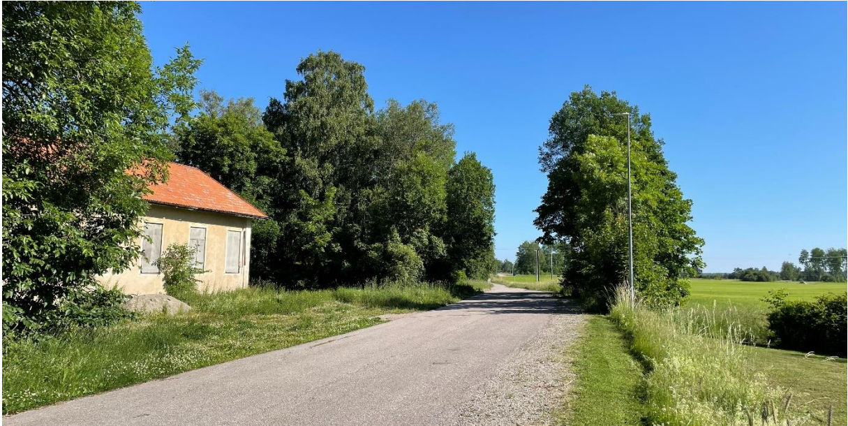
En före detta skolbyggnad längs vägen mot före detta prästgården.