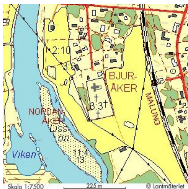
Yttermalungs kapell, Bjuråker 3:3