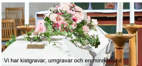
Vi har kistgravar, urngravar och en minneslund

När en anhörig avlidit och det är aktuellt att besluta om gravsättning finns det olika möjligheter för hur detta ska ske. En gravsättning är definitiv och bör vara väl genomtänkt. Det första ställningstagandet är att besluta om den avlidne ska kremeras eller gravsättas i kista, så kallad jordbegravning. Den avlidnes egna önskan bör följas. Enligt ny lag som trädde i kraft 1 maj 2012 ska den avlidne gravsättas i kistgrav alternativt kremeras senast en månad efter dödsfallet (tidigare två månader). Skatteverket utfärdar intyg för gravsättning alternativt kremering och får medge anstånd om det finns särskilda skäl. Anhöriga ges möjlighet att välja gravplats genom att kontakta kyrkogårdens lagas som anvisar olika alternativ. Den kristna riten för att säga farväl och tacka för en människas liv är en gudstjänst.