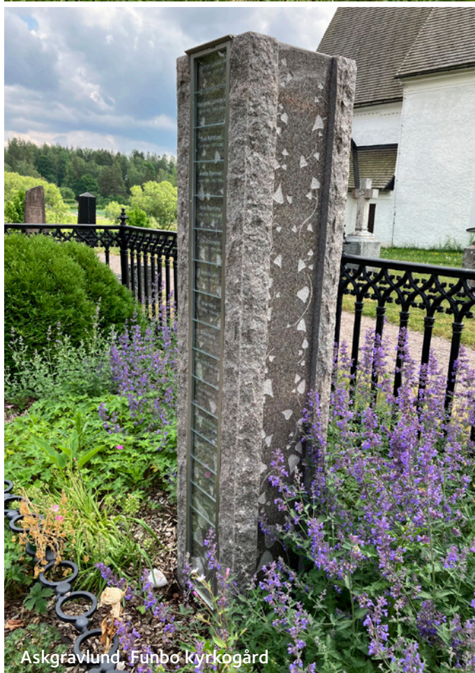
Askgravlund, Funbo kyrkogård