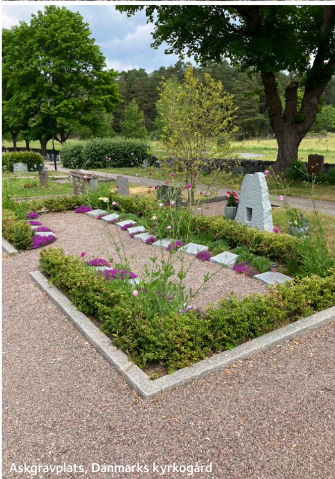
Askgravplats, Danmarks kyrkogård