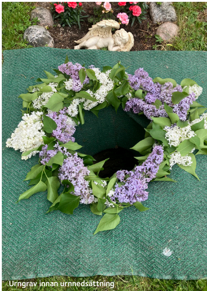
Urngrav innan urnnedsättning