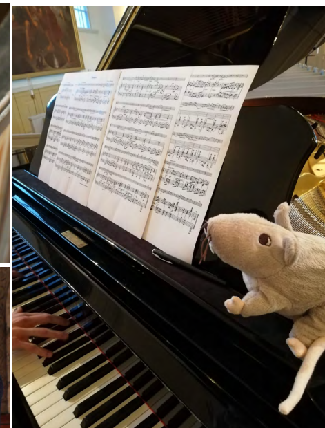
En kyrkråtta på äventyr.

Söderfors och Tierps kyrkor har drabbats av en kyrkråtta. Men inte en råtta vilken som helst. Den här är en nyfiken, tokig och mysig kyrkråtta. Den gillar ost mer än elkablar, äventyr mer än att ställa till det, och så gillar den att se och följa med i vad som händer. Till första advent dök den upp i Söderfors kyrka, strax efter i Tierps