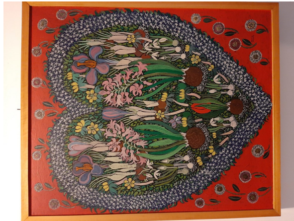
En av de vackra tavlorna som visas på Lukasgården framöver.