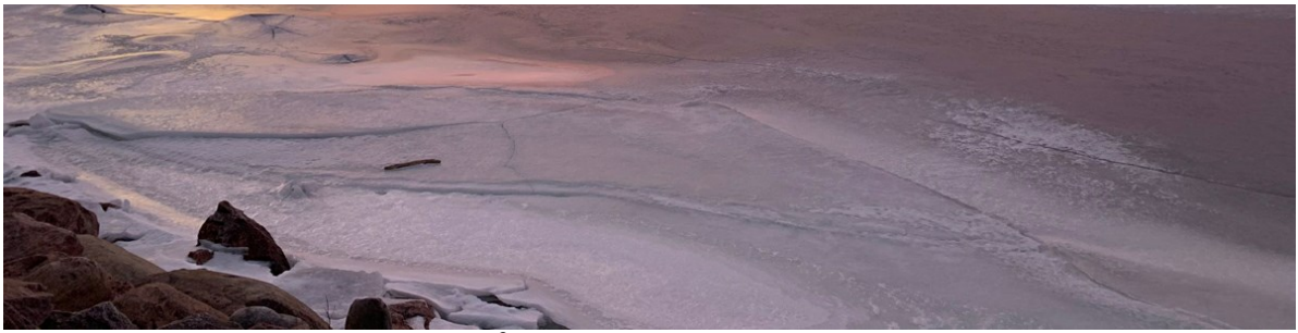
Hälsningar från Finland med en vacker februarimorgonbild.

HEMSIDA | SKICKA VIDARE | PRENUMERERA | REDAKTÖR: maria.patrizi@svenskakyrkan.se