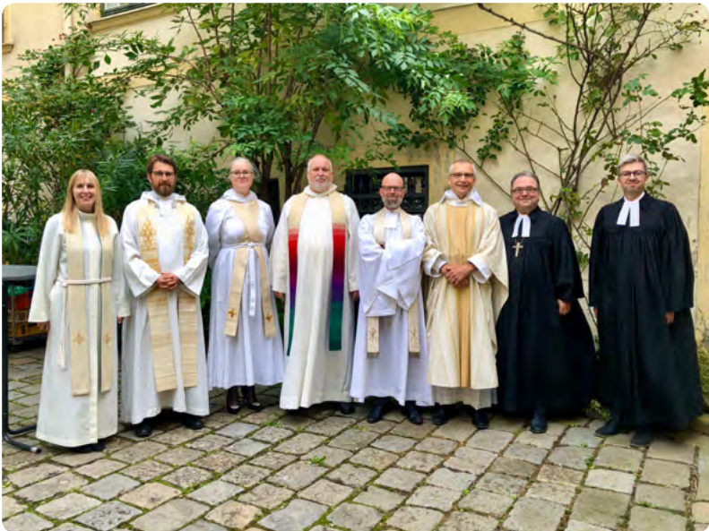
Prästerna som medverkade på jubileumsgudstjänsten