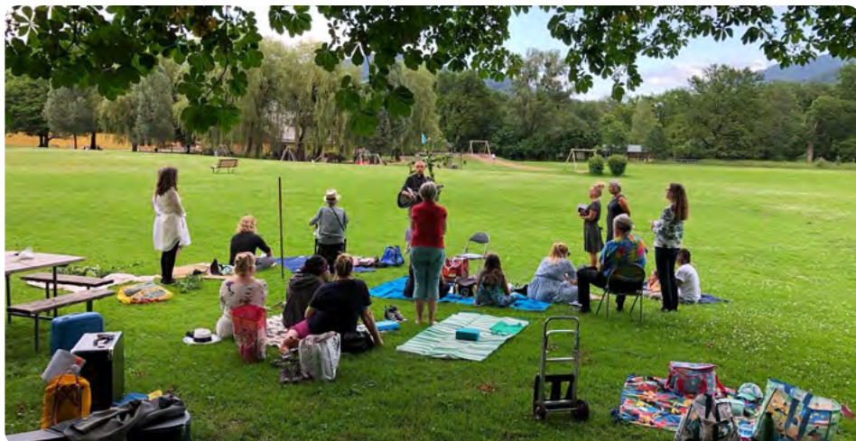
Midsommarfirande i Salzburg

På midsommarafton firade vi i Salzburg. Den här gången utomhus i den vackra slottsparken i Hellbrunn. Några sommarsalmer och ett par danslåtar kring midsommarstången hanns med innan ovädret brakade loss och påminde oss om svenskt midsommarklimat.