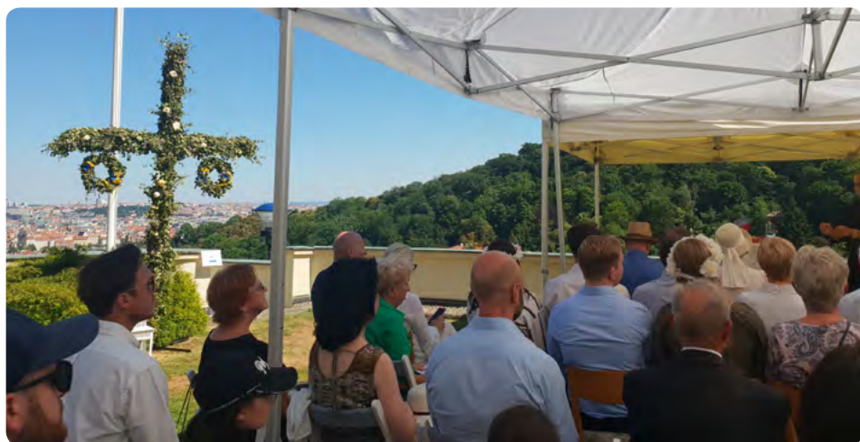
Sommarfest med traditionell midsommarstång och utsikt över Prag

en generositet från ambassadens kök som trivdes väldigt bra i våra munnar. Vidare firades sommargudstjänst och sommarfest i samarbete med Sveriges ambassad i Prag den 23 juni. Även här med en oerhörd utsikt över staden och en generositet från ambassadens kök som trivdes väldigt bra i våra munnar.