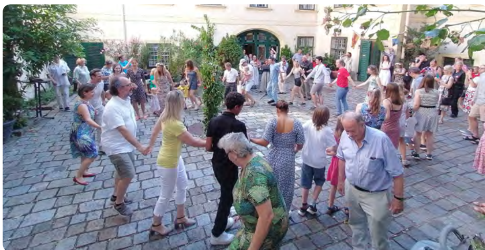
Många ville vara med och dansa runt midsommarstången på Gentzgasse

Slutligen var det högmässa med sommarfest med dans och buffé på Gentzgasse den 26 juni. Oerhört befriande att äntligen se en stor skara människor på vår innergård och att alla stolar i kyrkan behövdes för gudstjänsten.