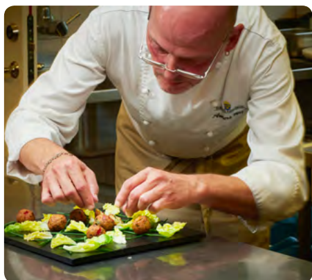
Det är viktigt att rätterna läggs upp snyggt!

Jag blev lurad av några vänner att delta i Sveriges mästerkock eftersom jag har ett stort intresse för just mat och kommer från en matfamilj med den gamla stammen av "kalaskokerskor" i flera led, och är van vid stora tillställningar och jag hängde alltid i köket och noterade allt så liten jag var. Smak och visuellt seende har alltid legat mig nära och framförallt är jag nyfiken. Efter min korta sejour i TV valde jag att lämna trädgården och gå in i köket istället, så jag har ingen formell utbildning, men