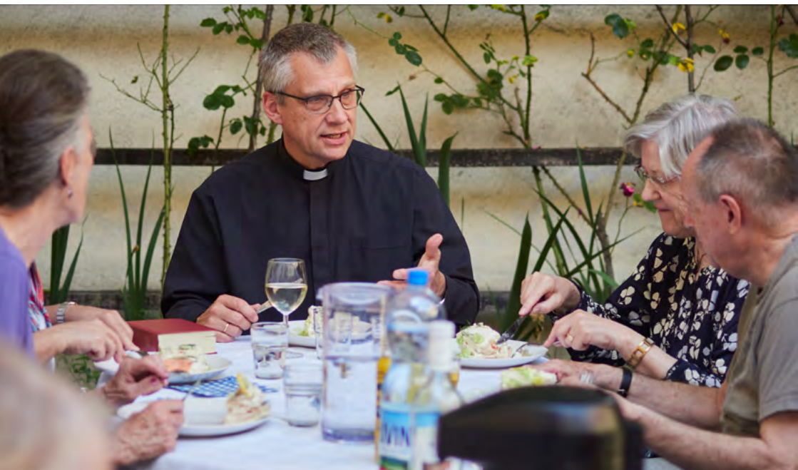
Seniorgruppen träffas första onsdagen i månaden.