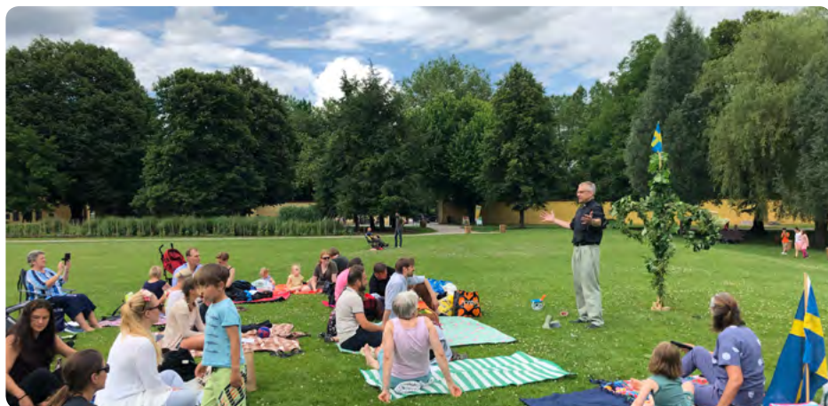
Midsommarafton i Salzburg. Sommgudstjänst, dans runt stängen och pic-nic i parken