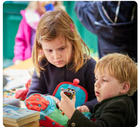
Det finns mycket spännande att upptäcka på loppisen