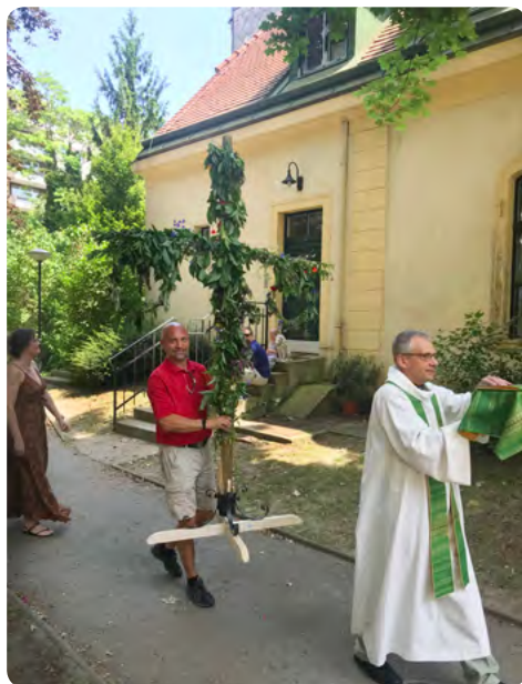
Sommargudstjänst med sommarfest på Gentzgasse