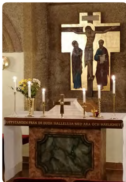
Altaret i Sala Terrena

Ur relationen till Gud växer uppgifterna fram, vi förstår vad vi är kallade till: att undervisa, vittna och missionera samt göra det goda genom diakonin. Att försöka underordna gudstjänst låter sig inte göras. Utan gudstjänst blir de övriga uppdragen tomma och konturlösa. Relationen till Gud är inte heller något enskilt och personligt. Det är som församling, en gemenskap i Kristus, som vi blir utrustade, sända och kan utföra uppdragen i världen!