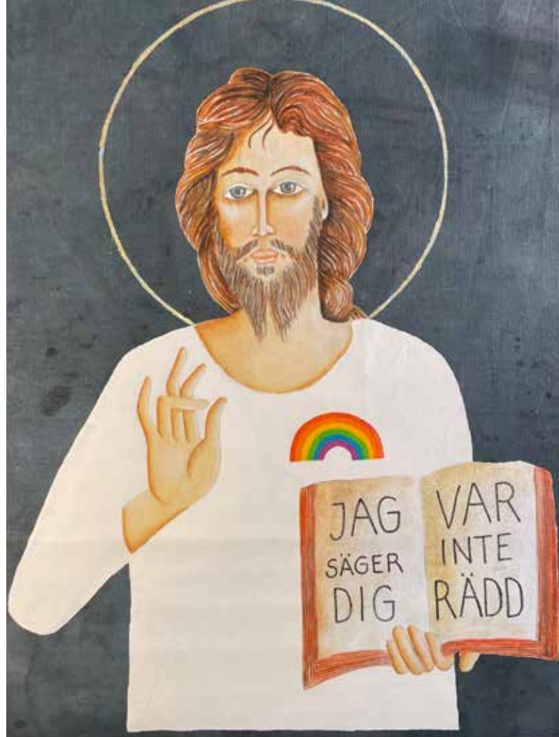
Presenningsikoner målade av Mats Hermansson.