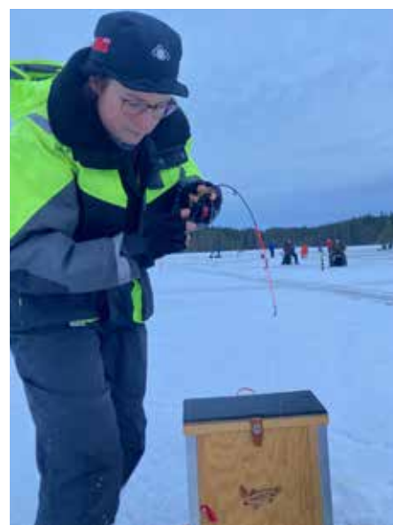
Malin drillar röding.