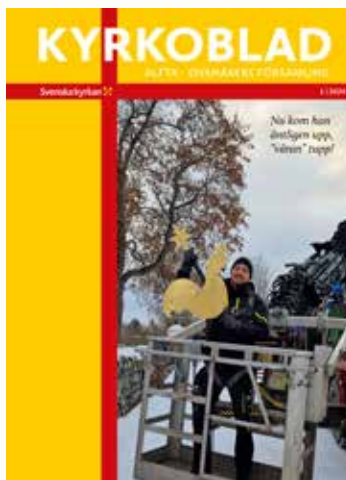
Framsidesbild "Kyrktupp."