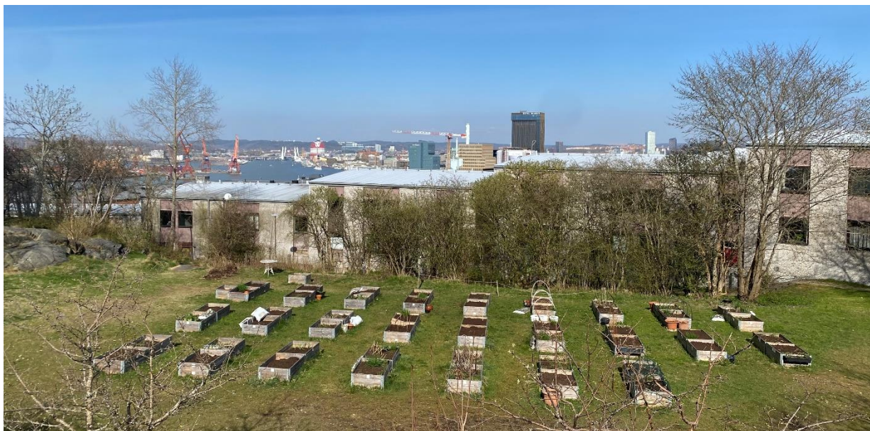
Odlingsföreningen har 50 pallkragar om fördelats på 34 medlemmar. Odlingsytan är belägen i nära anslutning till Masthuggskyrkan.

2023 var det femte verksamhetsåret för föreningen. Inom föreningen finns 50 pallkragar som under 2023 fördelades mellan 34 odlare. Av dessa var 9 nya medlemmar i föreningen.