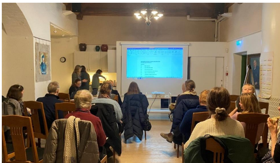
Föreningens årsmöte genomfördes i Klingnersalen i Masthuggskyrkans Annex.

På årsmötet enades medlemmarna om att medlemsavgiften skulle vara oförändrad för 2023, det vill säga att det ska kosta 200 kronor per pallkrage. I avgiften ingår förutom odlingsmöjlighet i pallkragen, gödsel och jord till de som behöver samt tillgång till vatten och verktyg vid odlingsytan.