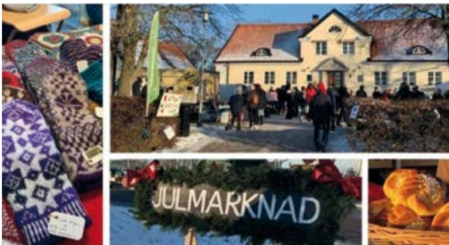
Bild från Reko-ring Stångby

Lör 16 dec kl 10-13. Reko-ringens arrangörer samarbetar med Torns församling, Byalaget Stångbymiljö, Torns IF och Scouterna. Det kommer att finnas flera producenter som säljer mat och besökare kan även köpa glass och olika sorters fika. För barnen kommer det att finnas både lotteri och klimatsmart fiskdamm. Kanske tillkommer någon aktivitet eller överraskning? Julmarknaden äger rum mitt i Stångby kring församlingsgården / Torns IF / Torngården. Alla hälsas varmt välkomna!