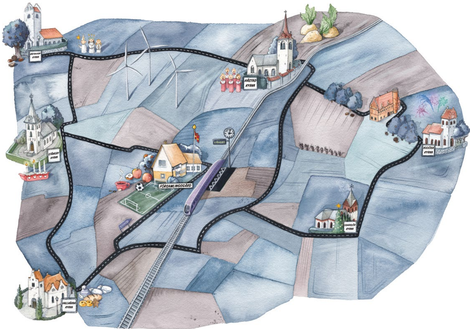
Illustration: Jenny Lindqvist

TORNS FÖRSAMLING finns där horisonterna öppnar sig, där landsbygd möter stad och tradition möter utveckling. Församlingen består av sex kyrkor: Stångby, Vallkärra, Igelösa, Västra Hoby och Håstad samt den nedlagda kyrkan i Odarslöv.