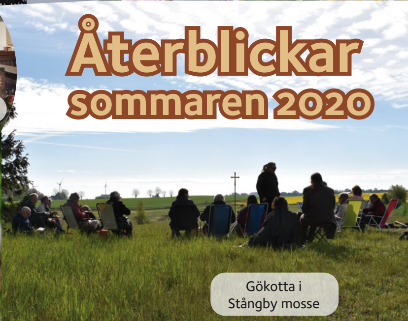
Gökotta i Stångby mosse