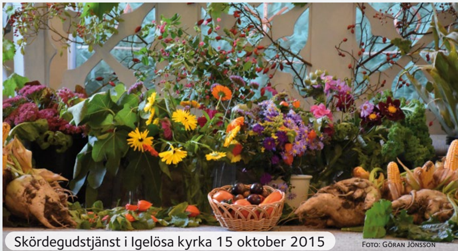
Skördegudstjänst i Igelösa kyrka 15 oktober 2015

Med reservation för eventuella ändringar. Håll därför utkik på Torns hemsida, Kyrkguiden eller anslagstavlor