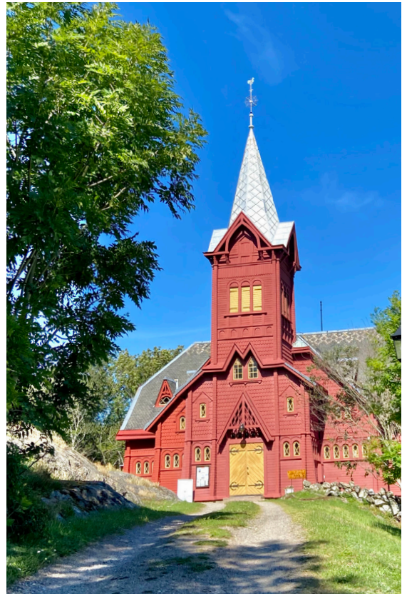
Det är framförallt exteriören som bär inspiration av de norska stavkyrkorna.

Kyrkan var inte röd som idag från början utan den målades i olika kulörer såsom rödbrunt och brons på fasader, bronskulör på foder och grönaktigt på bågar och dörrblad. Kyrkan är mycket välbevarad sedan byggnadstiden, såväl exteriört som interiört, med endast smärre ändringar gjorda vid renove-ringarna 1934 och 1976-77. Utvändig ommålning med reparation av fasadpartier i tornet samt avvattningssystemet utfördes 1994, fasader mot norrsidan målades 2005 samt fasader mot öster-, söder- och västsidorna målades senast 2012.