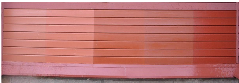
Provmålningar på fasaden visar olika färgfabrikat av linoljefärg samt olika nyanser av röd fasadfärg. Färdig provyta, 180911.