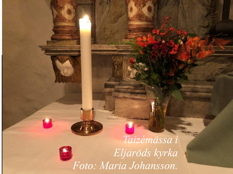
Taizemässa i Eljaröds kyrka