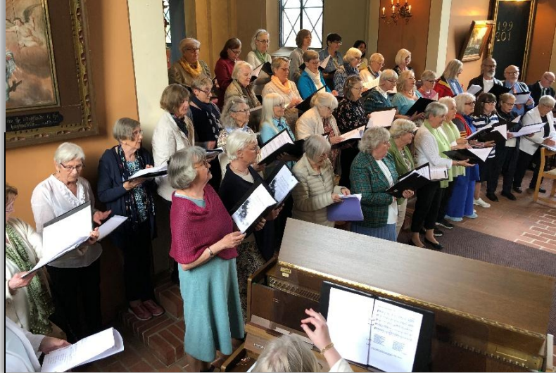
Vårkonsert i Skåne-Tranås kyrka med köerna från Brösarp-Tranås, Lund och Eslövs församling.

Barnkörernas uppsjungning på Dopfesten i Brösarps kyrka i februari.