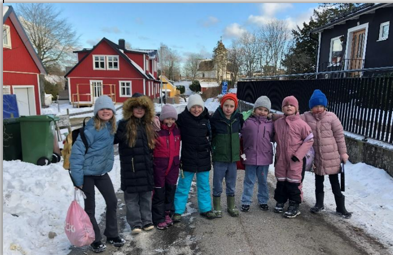
Sångfåglarna på väg till sin körövning i Brösarps kyrka.