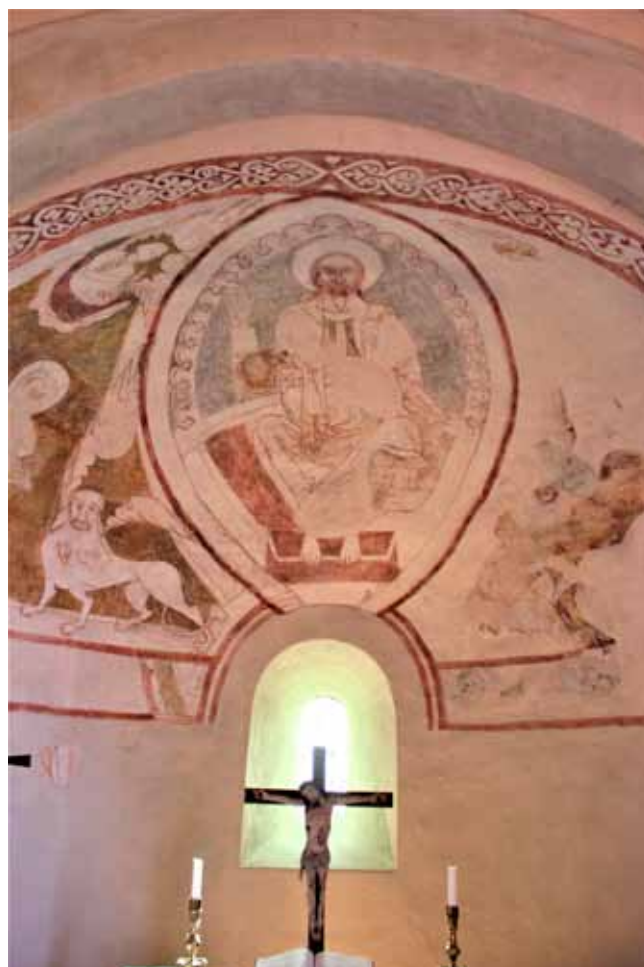
Kristus avbildad i Norrvidinge kyrkas kor. Kalkmålning från 1200-talet.

Men dagen har också ett annat namn. Den kallas Kristi Konungens dag – den dag då Kristus samlar alla som längtat efter upprättelse och rättvisa. I samtalen om