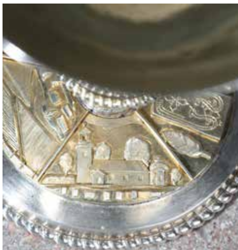
Kalk med reliefer på foten med olika motiv från Nykvarn.