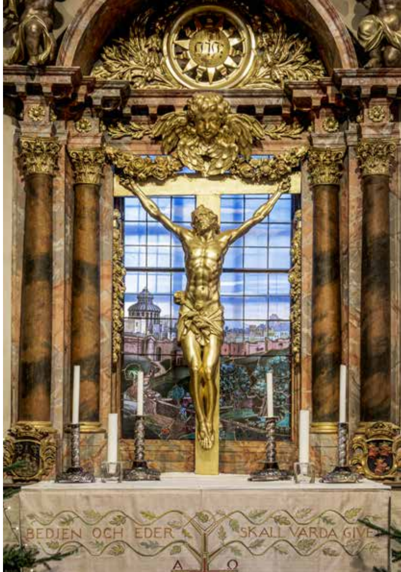
Ljusstakar från 1600-talet på altaret i Turinge kyrka.

Flera är de namn, kända som okända, som står bakom formgivning och tillverkning av dessa föremål. Det är en enorm kulturskatt som vi har att bevара och det sker med omsorg.