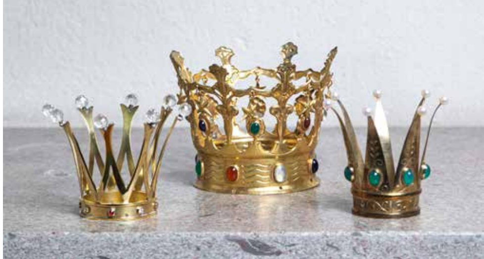
Brudkronor att låna till vigsel.