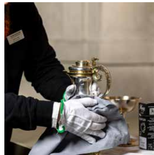
Viktigt att använda bomullshandskar.

Förutom den vackra, stilrena dopkannen, finns ett antal kalkar, alltså bägare till nattvarden i Turinge kyrkas ägor. Denna kalk tycker jag sticker ut, eftersom den har reliefer på foten med lokala motiv från Nykvarn; Turinge kyrka, Erik Dahlberghs monument och Nykvarns bruk.