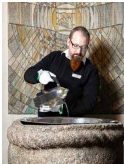
Dopskål från 1912 och dopfont från 1200-talet.