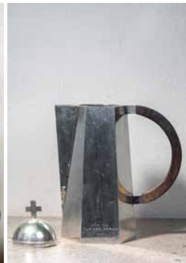
Kanna skänkt från Syföreningen 1959.