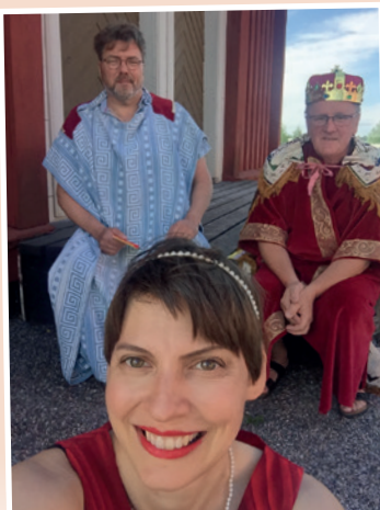
Profeten Samuel och kung David och drottning Ester