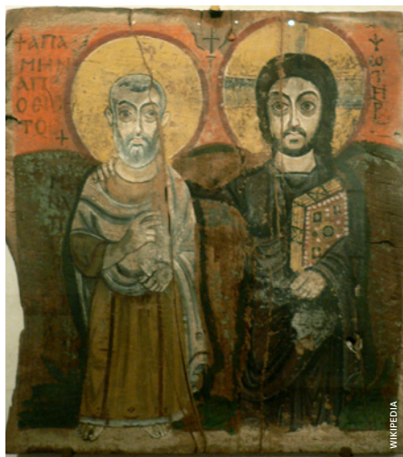
Vänskapens ikon från 600-talet där Jesus lägger armen om abba Minas.

Ur Tusen skäl att leva - Dom Helder Camara, Proprius förlag 1982