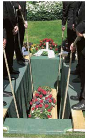
Torsten Bundsen /Ikon

Ersättning utgår till bärarna vid varje tjänstgöringstillfälle. Är du intresserad av att vara med i vårt bärarlag? Hör av dig till pastorexpeditionen på telefon 0581-378 50.