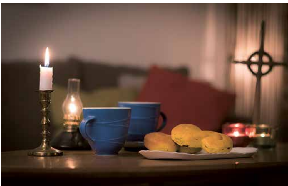
Gustaf Helsing /Ikon

välkomnar också kyrkoherde Per 13 december kl. 14.30 i Näsby församlingshem.