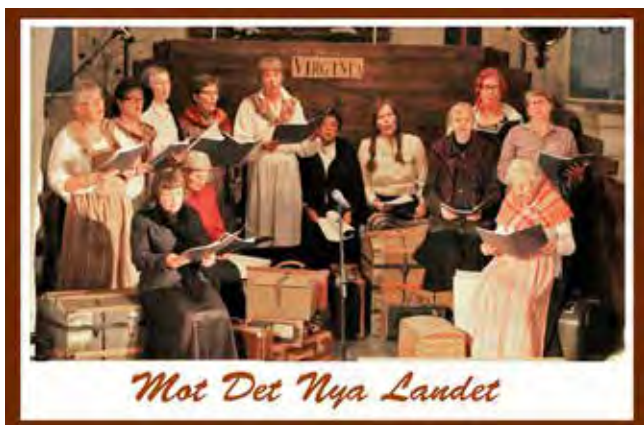
Arkivbild från 2012