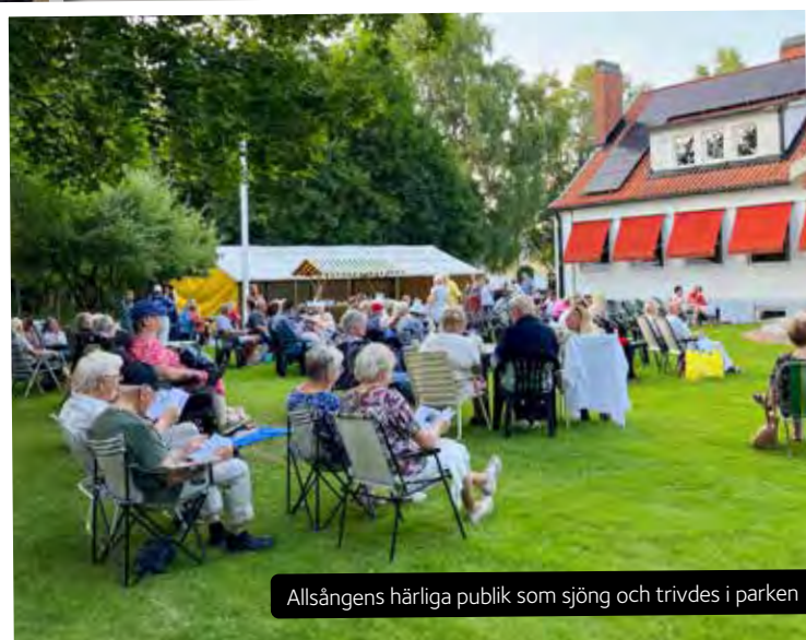
Allsångens härliga publik som sjöng och trivdes i parken