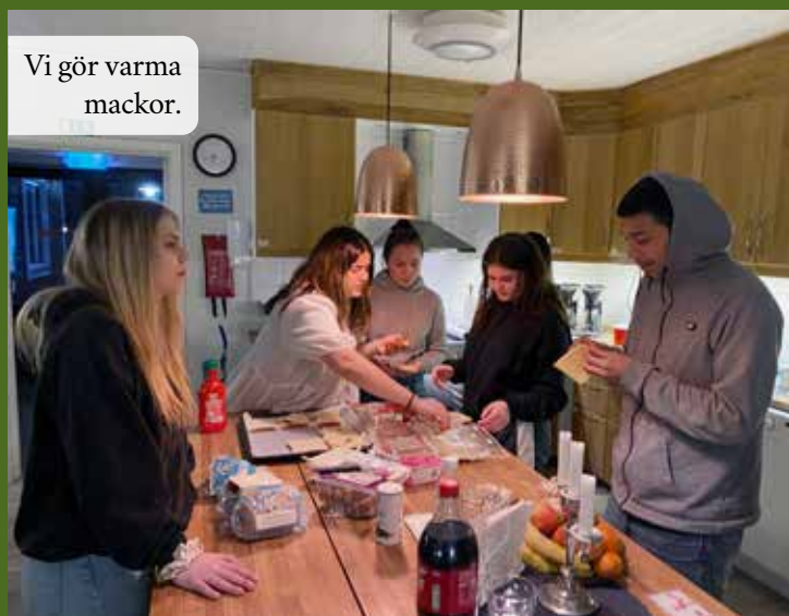
Vi gör varma mackor.