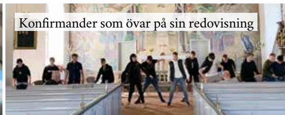
Konfirmander som övar på sin redovisning