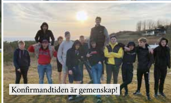
Konfirmandtiden är gemenskap!