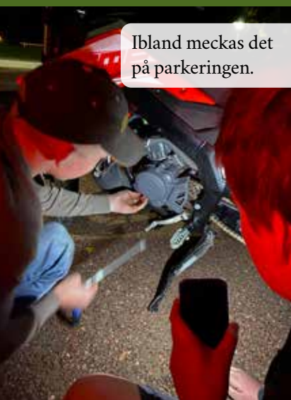
Ibland meckas det på parkeringen.