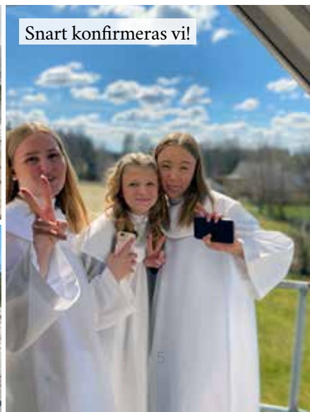
Snart konfirmeras vi!