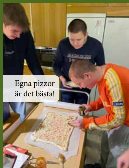
Egna pizzor är det bästa!