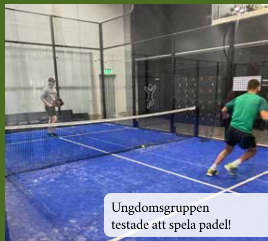
Ungdomsgruppen testade att spela padel!