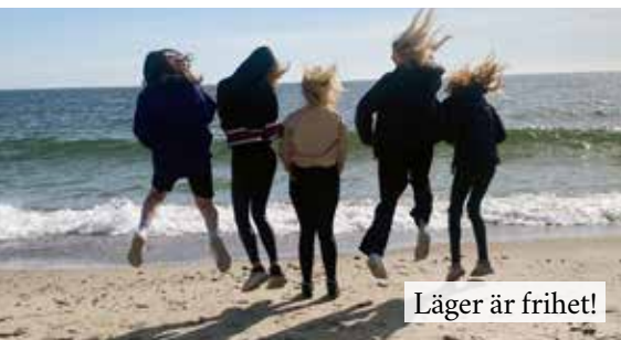
Läger är frihet!

Här är några bilder från vad vi har hittat på under året. Snart kommer utskick till årets konfirmandgrupper för dig som är född 2008!